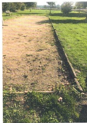
Die Boulebahn wird saniert

Die Boulebahn in Lüdersburg beim Sportplatz benötigt dringend einen neuen Oberbo-